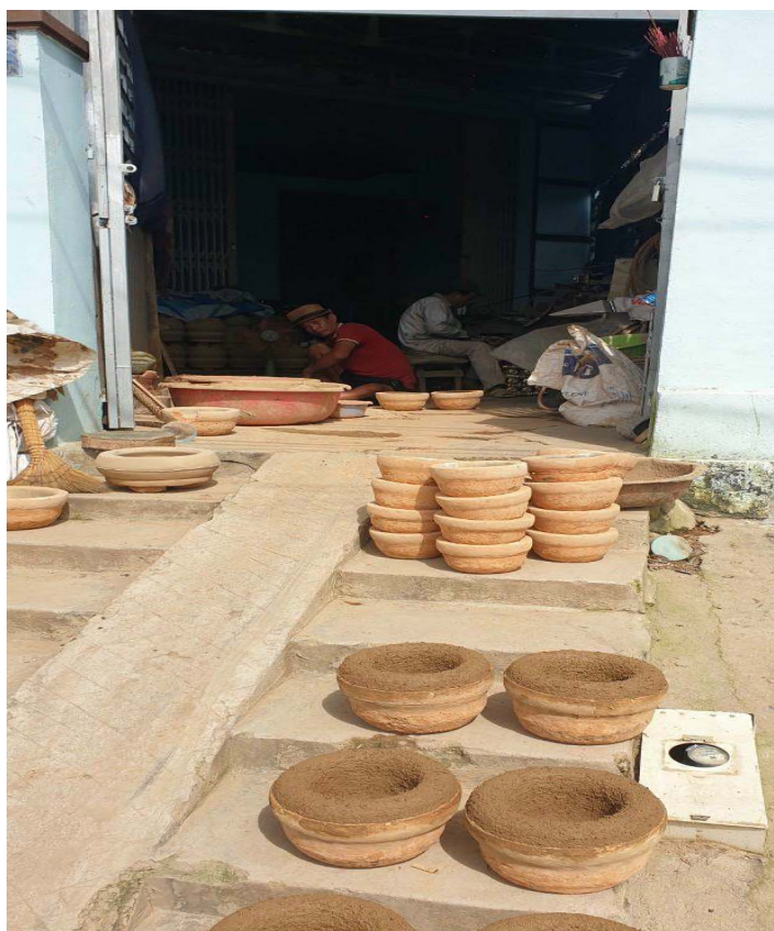
Nghề đúc đồng ở Khánh Hòa

trì thông qua các hội diễn nghệ thuật quần chúng, liên hoan các làn điệu dân ca Raglai, ngày văn hóa các dân tộc, hội thi tìm hiểu di sản văn hóa... công tác tổ chức lễ hội đã được thực hiện bài bản, trang nghiêm, lành mạnh, đảm bảo phục vụ nhu cầu tín ngưỡng của người dân trong, ngoài tỉnh. Các lễ hội khác như: Lễ dâng hương tưởng niệm các Vua Hùng tại đền Hùng Vương; Am Chúa; cúng lăng, cúng đình ở các xã, phường... Trong đó, tập trung tái hiện các lễ hội truyền thống, như: Lễ ăn mừng lúa mới; lễ cưới; lễ tạ ơn... Đây là những điều kiện thuận lợi cho ngành du lịch Khánh Hòa hướng tới lĩnh vực du lịch cộng đồng, khám phá, quảng bá bản sắc văn hóa, làm đa dạng hóa các sản phẩm du lịch đó chính là sự phát triển bền vững gắn du lịch với văn hóa.